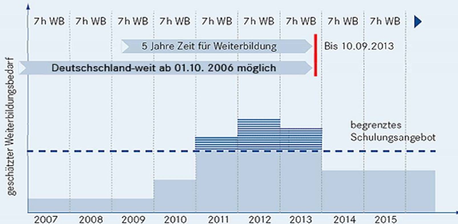
Zeitplan der Weiterbildung (WB) Klasse D1, D1E, D, DE